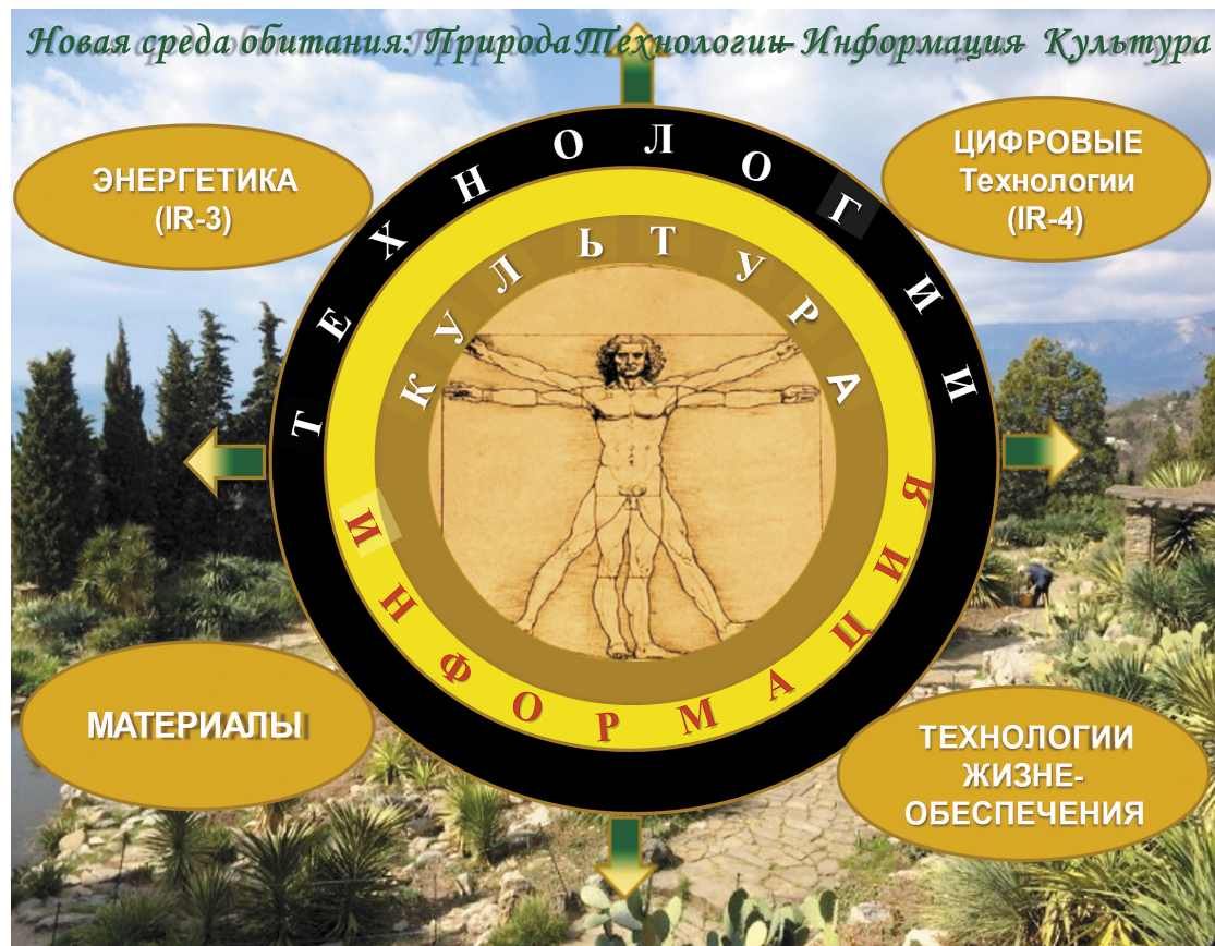
Рисунок 2. Новая среда обитания Figure 2. New Human Environment

Таким образом, сейчас есть все основания утверждать, что технологическое развитие меняет среду обитания человека, которую теперь надо рассматривать как совокупность естественной природной среды (nature), а также, технологического (technology), информационного (information) и культурного (culture) пространства (рис. 2).