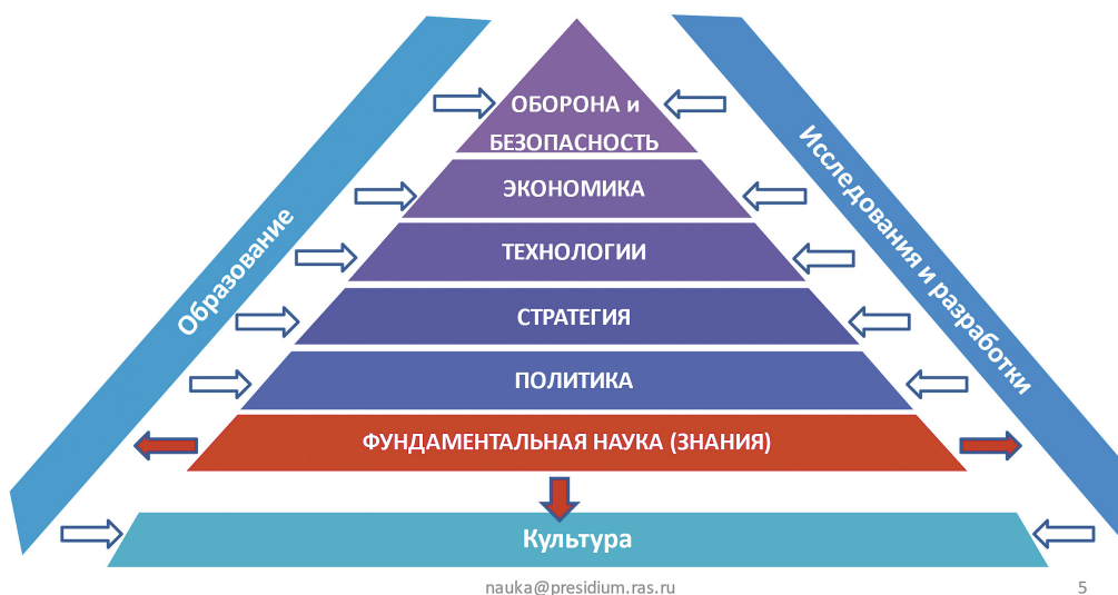
Рисунок 1. Фундаментальная наука как базовый институт развития Figure 1. Fundamental Science as a Basic Development Institution