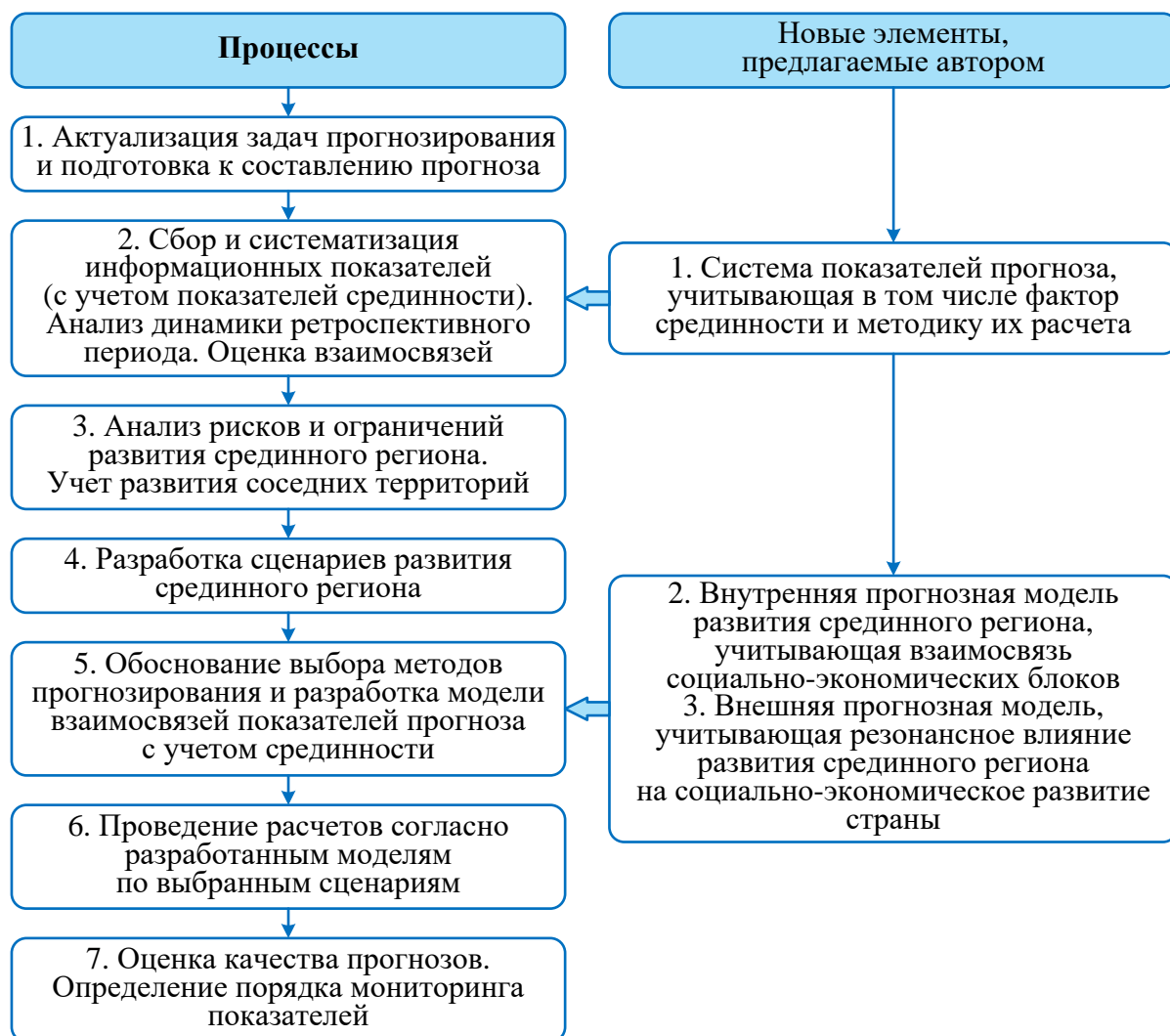
Рисунок 4 – Алгоритм разработки прогноза социально-экономического развития срединного региона

На основе выделенных особенностей автором обоснован алгоритм разработки прогноза социально-экономического развития срединного региона (рисунок 4).