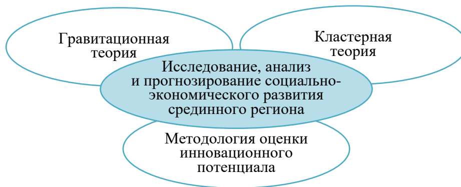
Рисунок 1 – Методологическая платформа исследования социально-экономического развития срединного региона

Физическую гравитационную модель органически дополняет функциональная кластерная теория , согласно которой срединный регион может рассматриваться как кластер – территориальная совокупность социально-экономических объектов и институтов, а также взаимосвязей между ними, эффективно реализующих конкурентные преимущества данной территории. Выявлено, что основные элементы кластера, такие как специализация, инновационность, наличие связей и взаимодействий между участниками, жизненный цикл и широкий набор участников, в полной мере могут быть применены к срединному региону.