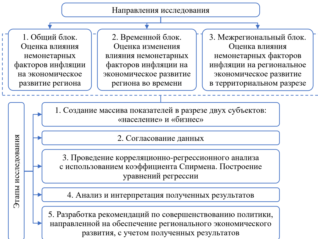
Рисунок 2 – Алгоритм методики оценки влияния немонетарных факторов инфляции на региональное экономическое развитие

Схема разработанной автором методики представлена на рисунке 2. Предлагаемая методика включает несколько этапов, каждый из которых предполагает использование определенного инструментария.