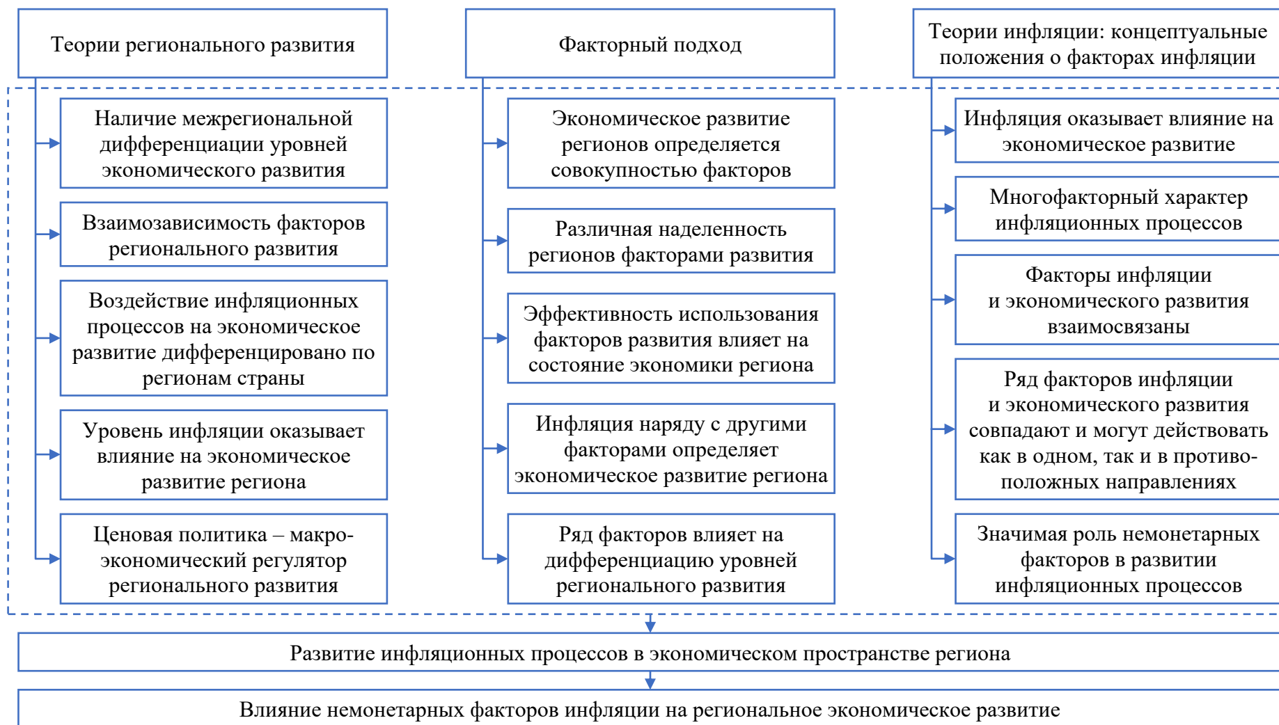
Рисунок 1 – Обобщение положений теорий регионального развития, концептуальных положений теорий инфляции о факторах инфляции и факторного подхода к исследованию немонетарных факторов инфляции в региональной экономике