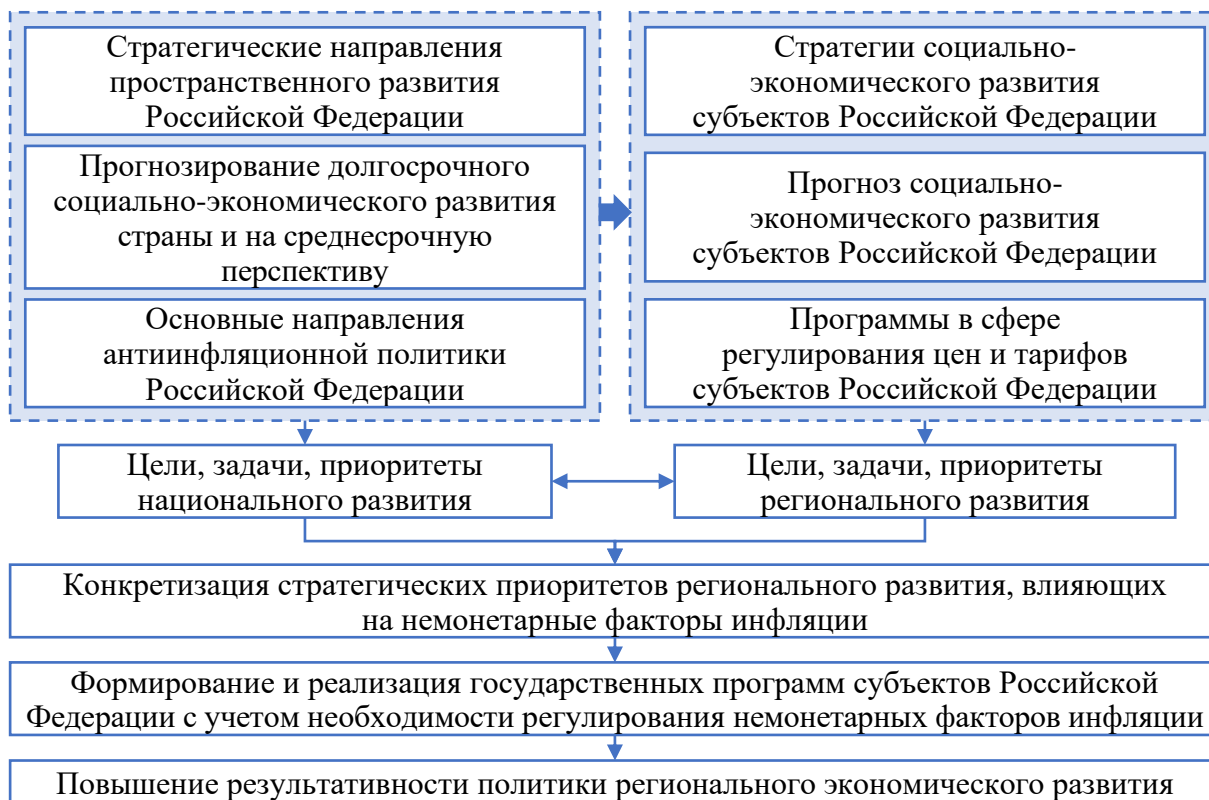
Рисунок 3 – Общая схема формирования политики в сфере регулирования немонетарных факторов инфляции в субъекте Российской Федерации

Немонетарные факторы инфляции оказывают влияние на региональное экономическое развитие, что нашло отражение в выявленных аспектах раскрытия сущности данной категории и позволило аргументировать тезис о том, что направленная на регулирование инфляции политика должна быть сопряжена с направлениями деятельности органов регионального управления. Именно поэтому автором проведен анализ стратегических и программных документов органов государственной власти субъектов Российской Федерации, входящих в состав Уральского макрорегиона, на предмет отражения в них целей экономического развития в целом и направлений регулирования немонетарных факторов инфляции в частности. В результате проведенного анализа автором разработана общая схема формирования политики в сфере регулирования немонетарных факторов инфляции в экономическом пространстве субъекта РФ, опирающаяся на ключевые позиции, заложенные в стратегиях их социально-экономического развития (рисунок 3).