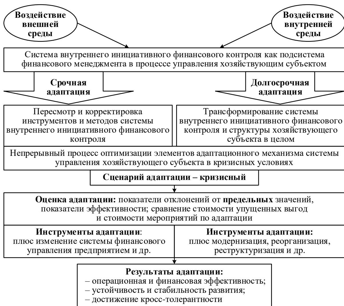
Рисунок 7 – Модель адаптационного механизма системы внутреннего инициативного финансового контроля при кризисном сценарии

В модели, характеризующей кризисный сценарий, ключевой задачей является поддержание ликвидности хозяйствующего субъекта и ряда других показателей (рисунок 7). Основным принцип балансирования ликвидности и доходности – обеспечение ликвидности при минимальном уровне доходности .