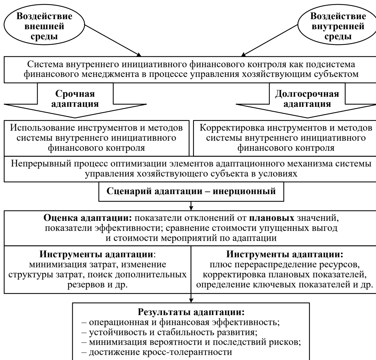
Рисунок 6 – Модель адаптационного механизма системы внутреннего инициативного финансового контроля при инерционном сценарии

Как правило, инерционный сценарий (рисунок 6) предполагает функционирование предприятия в рамках целевых плановых значений.