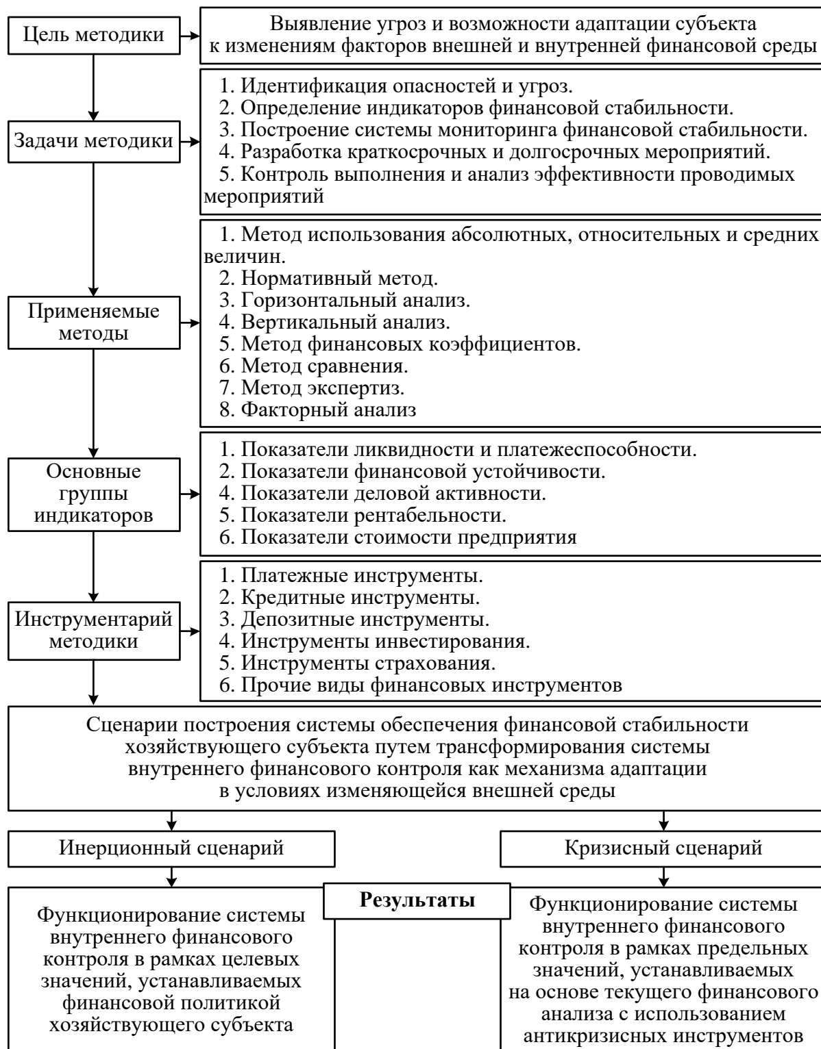
Рисунок 5 – Методика развития системы внутреннего инициативного финансового контроля хозяйствующего субъекта

туры для адаптации хозяйствующего субъекта, в том числе через трансформирование элементов системы внутреннего инициативного финансового контроля. Общая алгоритмическая модель представлена на рисунке 5 в виде методических положений, раскрывающих суть каждого элемента модели.