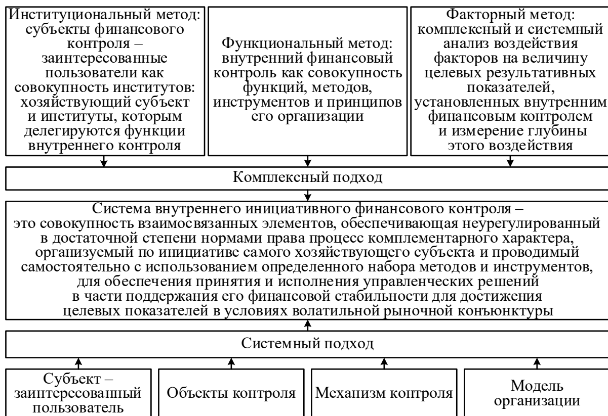
Рисунок 1 – Обоснование авторского определения внутреннего инициативного финансового контроля хозяйствующего субъекта на основе системно-комплексного подхода

Автор считает обоснованной необходимость интегративного исследования внутреннего инициативного финансового контроля как системы. Терминологически интегративность может быть отражена как системно-комплексный подход (рисунок 1).