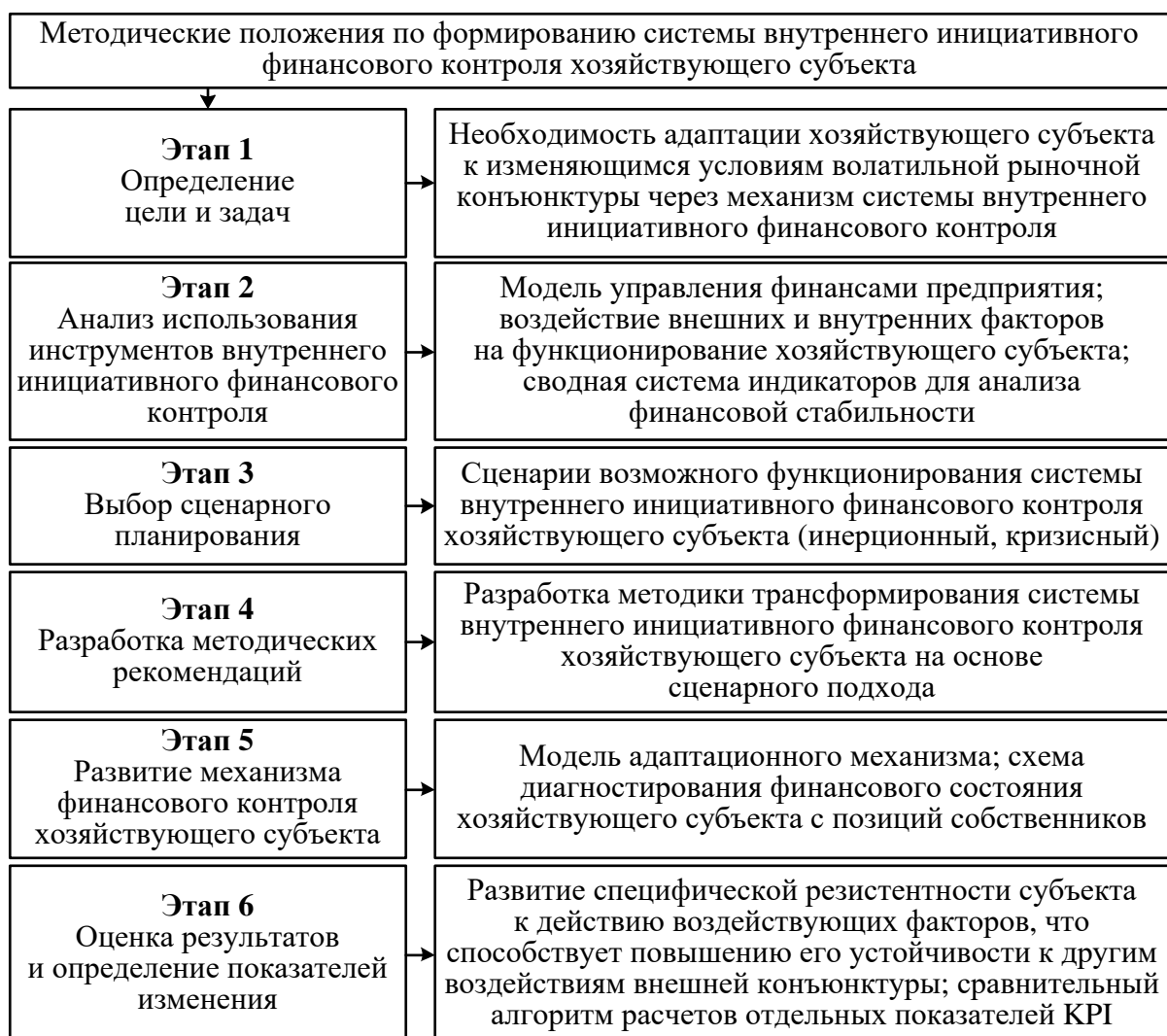
Рисунок 3 – Алгоритм использования методических положений по формированию системы внутреннего инициативного финансового контроля хозяйствующего субъекта

Внутренний инициативный финансовый контроль, реализуя адаптационную функцию, позволяет приспособливаться к условиям волатильной конъюнктуры через систему связей экономических показателей и факторов, определяющих направления функционирования хозяйствующих субъектов. Но сам процесс адаптации как приспособление хозяйствующего субъекта через изменение факторов внутренней среды в условиях качественного и количественного изменения факторов внешней среды требует методического обоснования. Методический подход представлен в виде совокупности положений, алгоритм реализации которых приведен на рисунке 3.