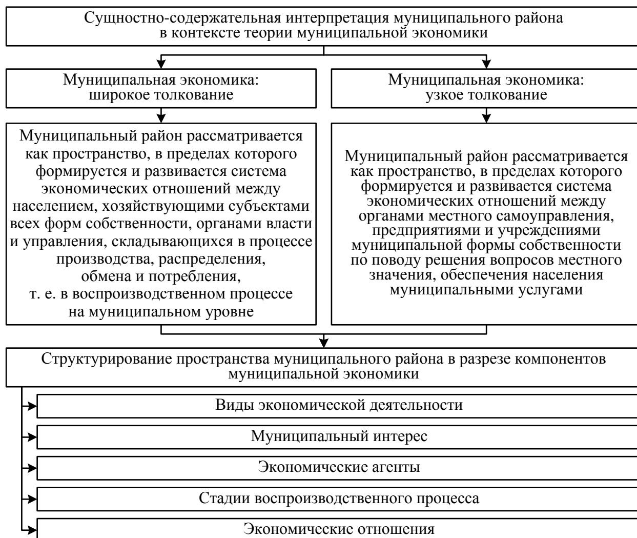
Рисунок 2 – Сущностно-содержательная интерпретация муниципального района в контексте теории муниципальной экономики

Таким образом, выражение сущности муниципального района в контексте приведенных выше подходов к муниципальной экономике и муниципальному хозяйству представляется следующим (рисунок 2).