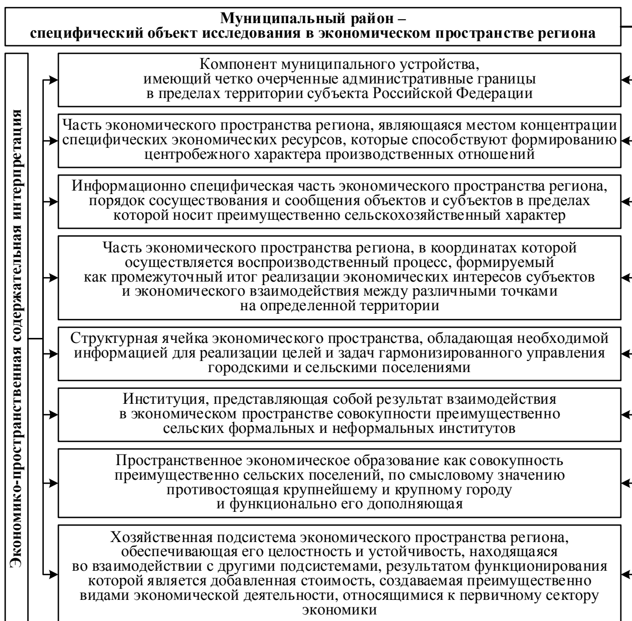
Рисунок 1 – Содержательная идентификация муниципальных районов в концепциях экономического пространства

а качество их осуществления зависит от социально-экономического состояния самих пространственных образований.