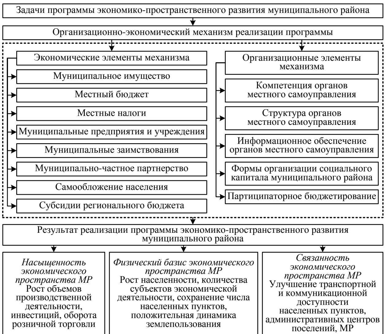
Рисунок 6 – Организационно-экономический механизм реализации программы экономико-пространственного развития муниципального района

Организационно-экономический механизм реализации предлагаемой муниципальной программы экономико-пространственного развития муниципального района представлен на рисунке 6.