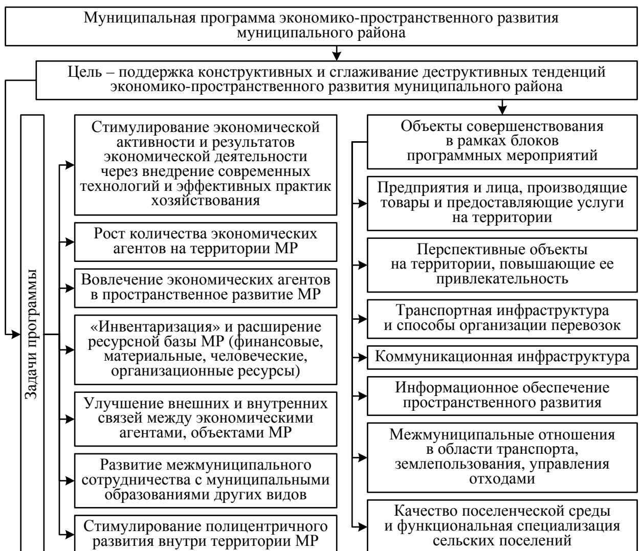
Рисунок 5 – Концептуальная схема муниципальной программы экономико-пространственного развития муниципального района

С целью внедрить лучшие практики по сформулированным направлениям и в соответствии со стратегическими приоритетами в отношении муниципальных районов автор считает возможным предложить концепцию муниципальной программы экономико-пространственного развития, направленной на поддержку конструктивных и сглаживание деструктивных тенденций экономико-пространственного развития муниципального района. Целевые установки и задачи предлагаемой муниципальной программы экономико-пространственного развития представлены на рисунке 5.