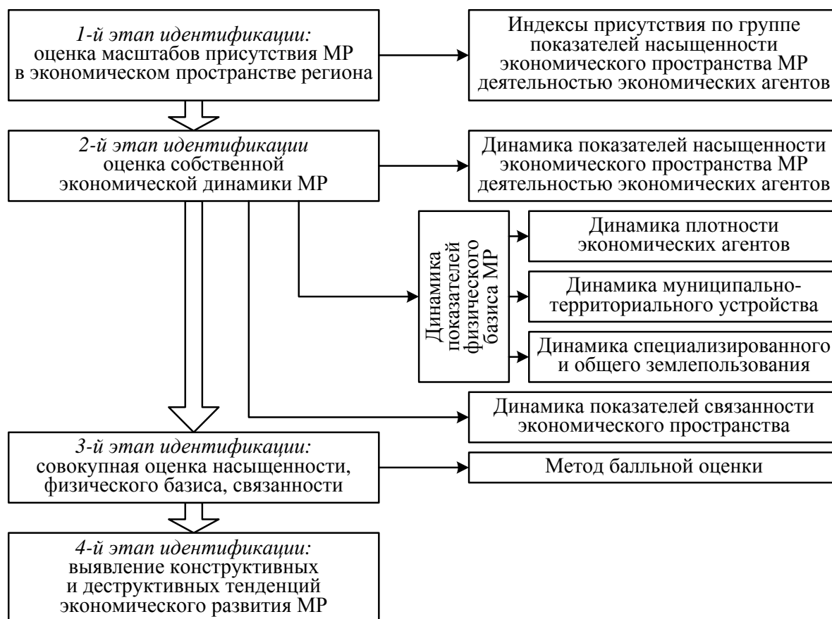
Рисунок 3 – Алгоритм методического подхода к идентификации тенденций (конструктивных и деструктивных) экономического развития муниципальных районов в экономическом пространстве региона