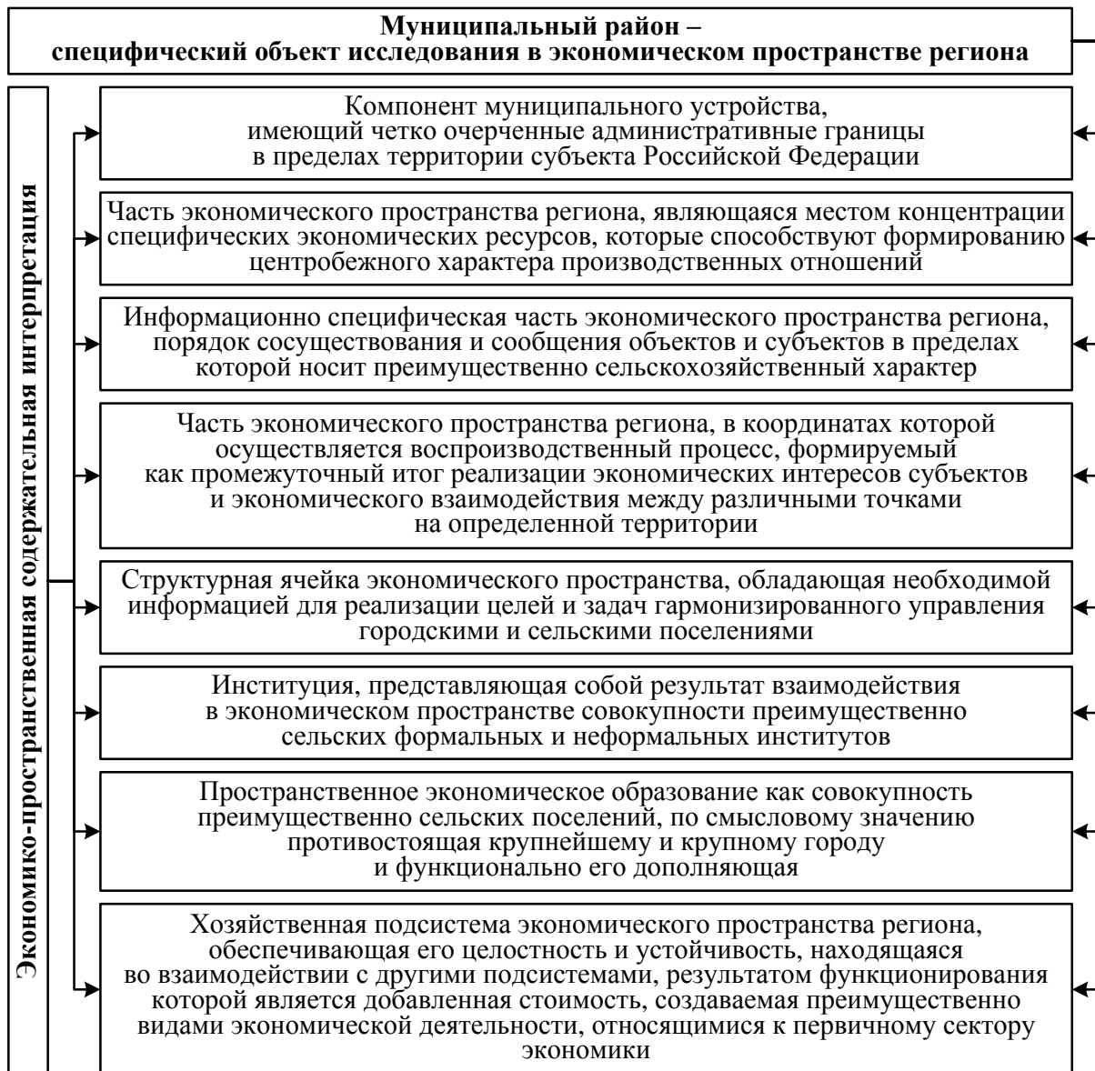
Рисунок 1 – Содержательная идентификация муниципального района в концепциях экономического пространства

Авторское обобщение положений различных подходов в рамках теории пространственной экономики позволяет представить пространственно-экономическую характеристику муниципального района (рисунок 1).