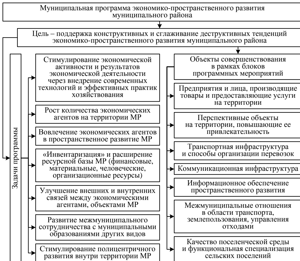
Рисунок 4 – Концептуальная схема муниципальной программы экономико-пространственного развития муниципального района

установки и задачи предлагаемой муниципальной программы экономико-пространственного развития представлены на рисунке 4.