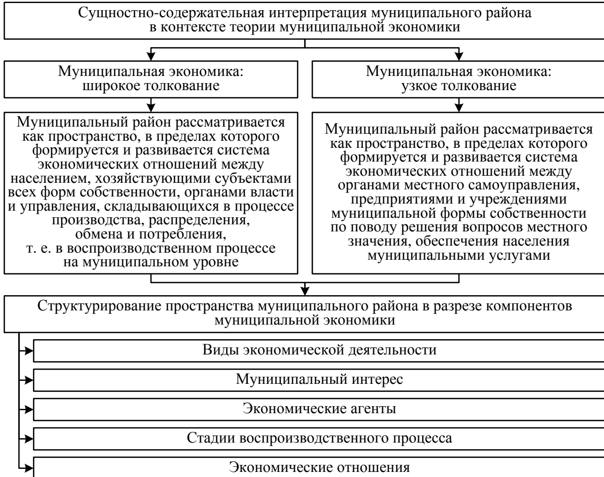
Рисунок 2 – Сущностно-содержательная интерпретация муниципального района в контексте теории муниципальной экономики

ществления местного самоуправления функционирует и развивается муниципальная экономика. Анализ подходов к определению сущности и границ муниципальной экономики позволил дать две интерпретации муниципального района и представить структурирование пространства муниципального района в разрезе компонентов муниципальной экономики (рисунок 2).