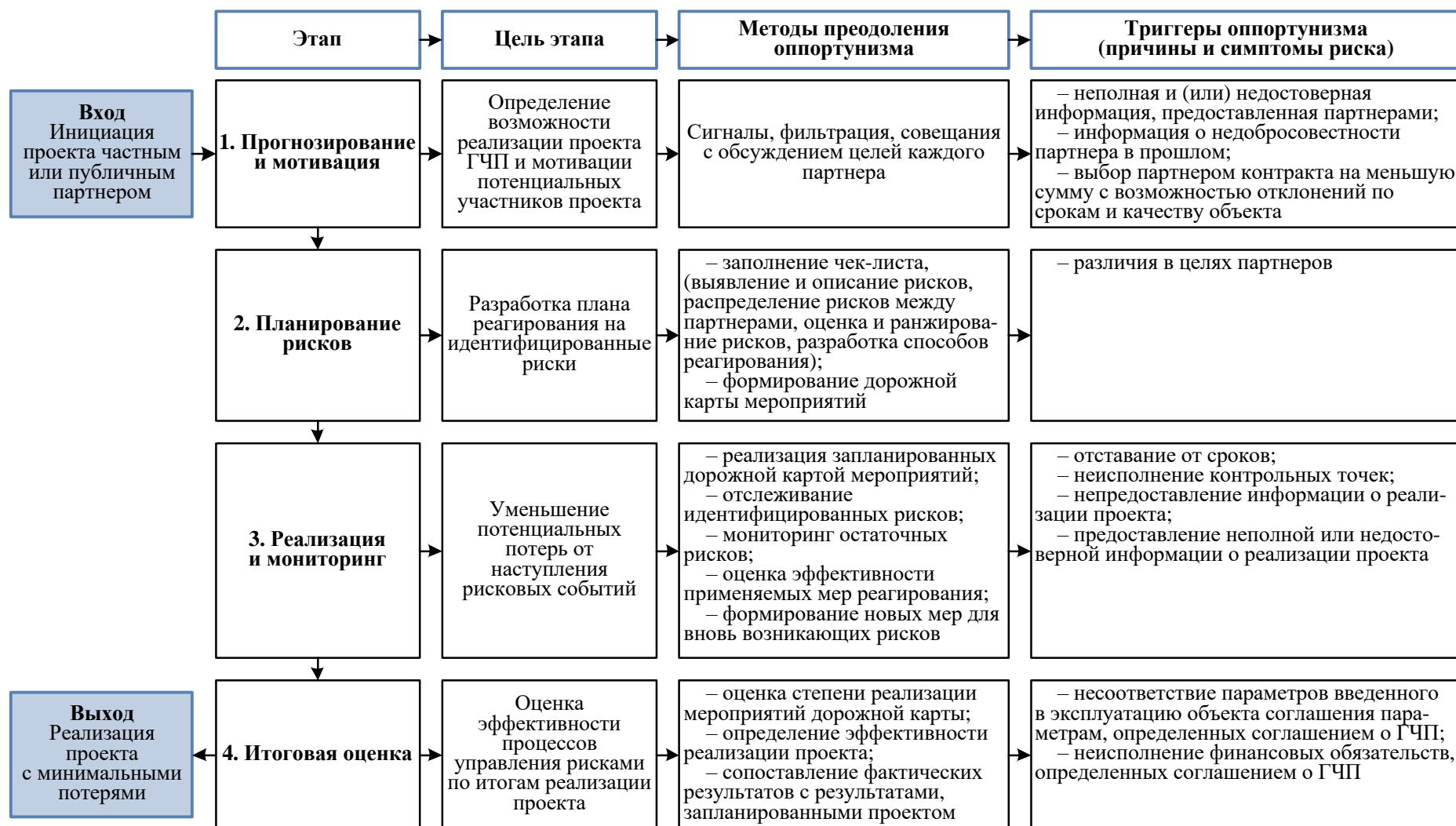
Рисунок 1 – Модель выявления и управления рисками оппортунизма проектов ГЧП