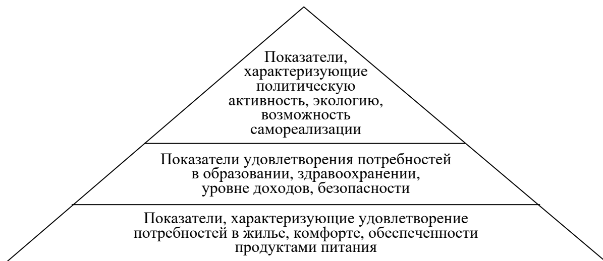
Рисунок 3 – Ранжирование показателей оценки качества жизни населения по уровню удовлетворения потребностей населения

населения по уровню удовлетворения потребностей населения. Всего нами было выделено три уровня показателей оценки качества жизни в зависимости от уровня удовлетворения потребностей населения (рисунок 3).