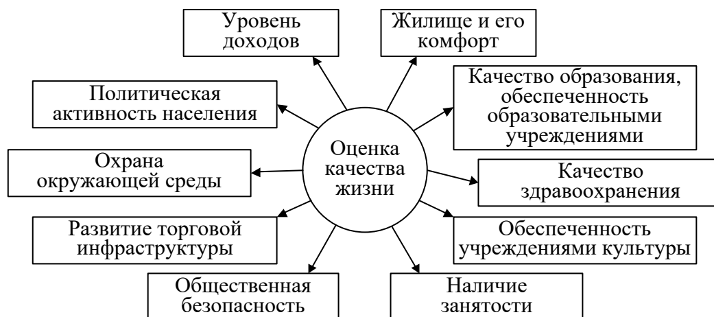
Рисунок 4 – Система блоков показателей, используемых в разработанной методике проведения анализа качества жизни для муниципального образования

Методика включает расчет следующих показателей (рисунок 4).