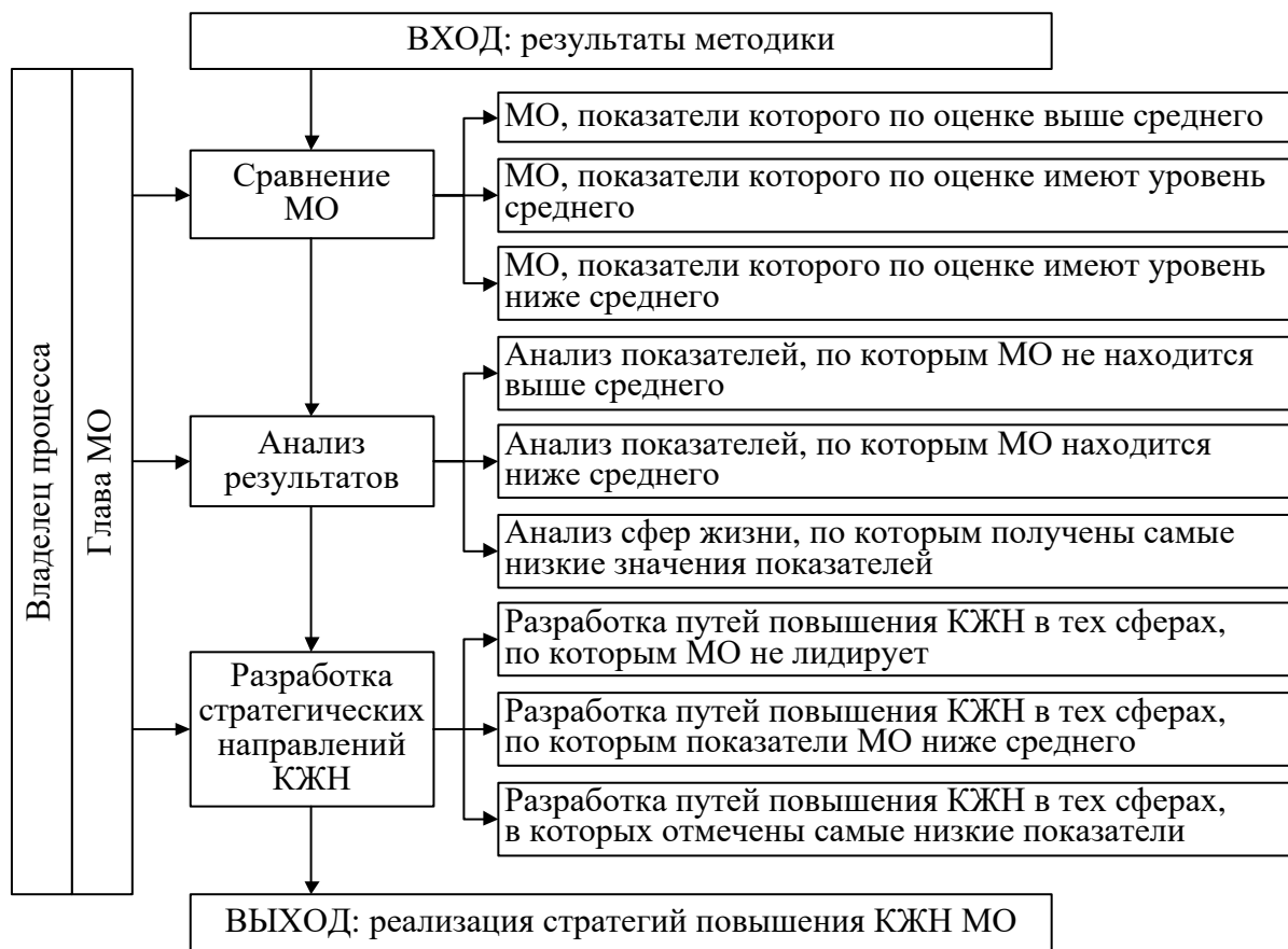
Рисунок 5 – Алгоритм повышения качества жизни на основе рейтинговой оценки

Для решения выявленных проблем качества жизни населения анализируемых городов Северного управленческого округа Свердловской области предлагаются следующие пути повышения уровня жизни населения (таблица 10).