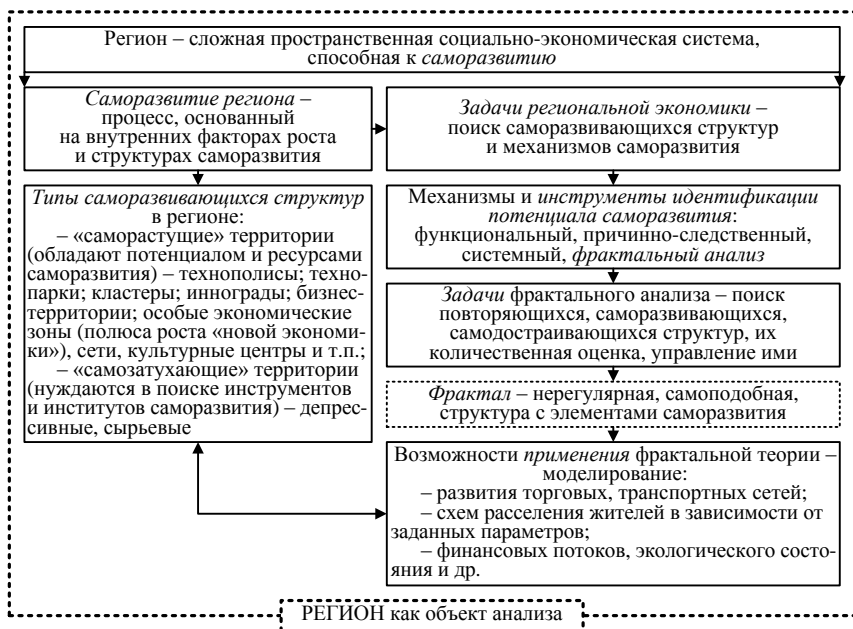
Рисунок 3 – Алгоритм включения фрактального подхода в анализ процессов развития и саморазвития региона

создания и прогнозирования развития различных аспектов и явлений социально-экономической системы (рисунок 3).