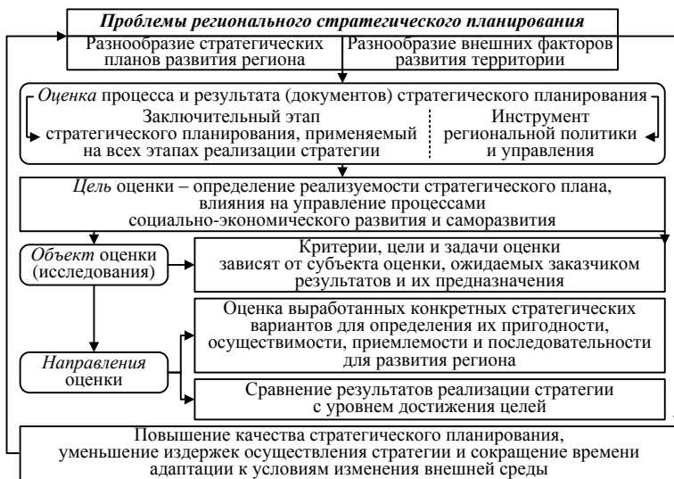
Рисунок 2 – Оценка как инструмент регионального стратегического планирования (разработана автором)

В диссертации доказано, что необходимым условием для уменьшения издержек осуществления стратегии и сокращения времени адаптации к условиям изменений внешней среды являются подбор, обоснование, внедрение инструментов контроля за разработкой и ходом стратегии, а также оценка ее результатов (рисунок 2).