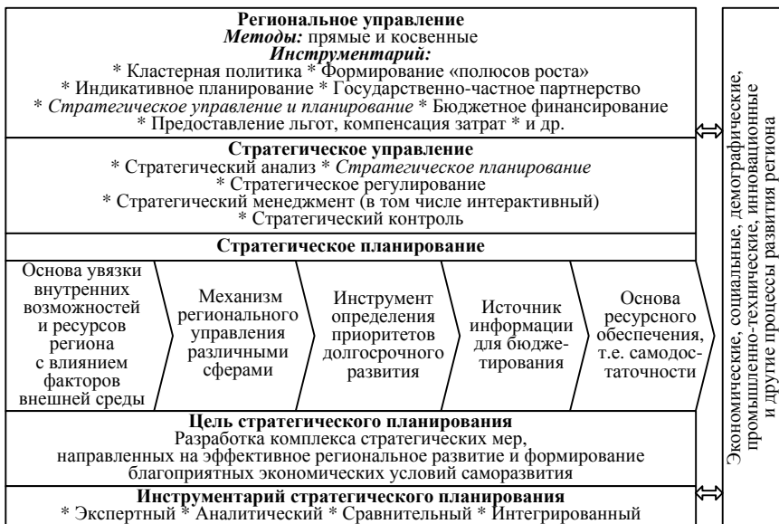
Рисунок 1 – Роль стратегического планирования развития региона в региональном управлении

Проведенное исследование позволило выявить свойство фрактальности стратегического планирования регионального развития, а именно фрактальный характер программных процессов, выражающихся через следующие категории – миссия, цель, стратегия, задачи, этапы, а также в управленческой и организационной деятельности.