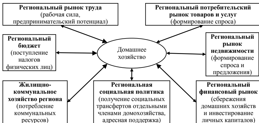
Рисунок 1 – Структурная схема взаимодействия сектора домашних хозяйств и основных компонентов региональной экономики

Как свидетельствуют результаты анализа, взаимодействие сектора домашних хозяйств в структуре региональной экономики предусматривает выполнение домохозяйствами важнейшей функции обеспечения потребительского спроса – этого первого и необходимого условия функционирования рыночного механизма. Сбережения домохозяйств, при условии их связи с рынком капитала, обеспечивают решение проблемы его накопления для оживления инвестиционной деятельности в трансформирующейся экономике. Важна роль домохозяйств и как субъектов предложения важнейших производственных ресурсов – труда и предпринимательской способности. Именно домохозяйство выступает основным звеном в цепи создания и накопления человеческого капитала, включая этапы его формирования, производства и реализации. Домашние хозяйства способны преобразовать на основе совместных ценностей местное хозяйство (в том числе жилищно-коммунальное), улучшить условия проживания в соответствии со своими интересами и потребностями.