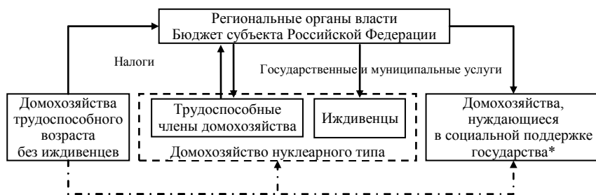
Рисунок 5 – Схема финансовых потоков между бюджетом субъекта РФ и бюджетами домашних хозяйств:

Взаимодействие между бюджетом субъекта РФ и бюджетом домашнего хозяйства происходит в части формирования не только доходов, но и расходов. Как показывает анализ, величина финансовых потоков между бюджетами зависит от внутренней структуры домохозяйства, в частности, от численности трудоспособных членов домашнего хозяйства и иждивенцев, проживания в городской или сельской местности, возраста и состояния здоровья членов домохозяйства, уровня их доходов и т.д. Взаимодействие и взаимное влияние бюджетов домашних хозяйств как субъектов рыночных отношений и бюджета Свердловской области представлено на рисунке 5.