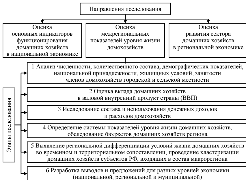
Рисунок 2 – Схема методики анализа сектора домашних хозяйств на разных территориальных уровнях

Учитывая функциональное содержание домашних хозяйств, автор предлагает совокупность способов и методов их исследования, базирующихся на использовании группы показателей официальной статистики. Общая концепция исследования включает ряд основных этапов (рисунок 2).