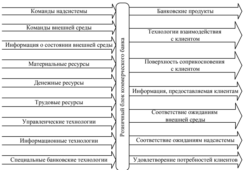
Рисунок 1 – Модель розничного блока как «чёрного ящика»