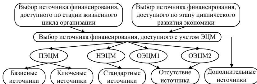
Рисунок 2 – Структурирование денежного капитала организации под воздействием эффектов циклической мультипликации экономики