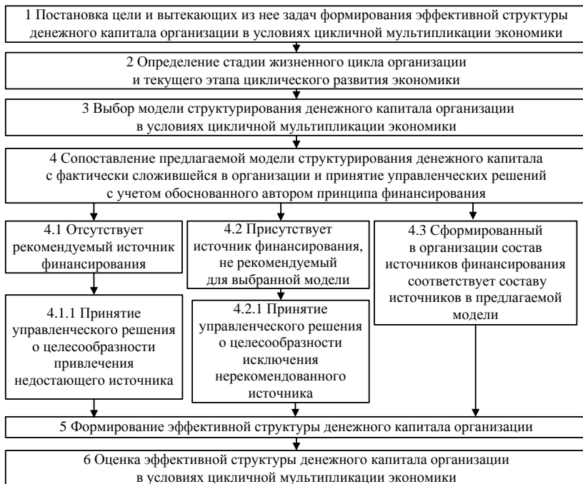
Рисунок 3 – Алгоритм формирования эффективной структуры денежного капитала организации в условиях цикличной мультипликации экономики

Предложенная автором методика формирования эффективной структуры денежного капитала организации в условиях цикличной мультипликации экономики включает 6 этапов (рисунок 3).